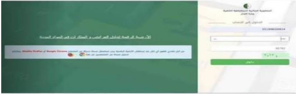
الشكل 01 103

يقوم المحامي بالولوج الى الارضية الرقمية المخصصة للتبادل الالكتروني للمذكرات والعرائض المتاحة عبر الانترنت، عن طريق الرابط الالكتروني www.tadjrib.mjustice.dz ، باستخدام الحساب الالكتروني الخاص به (اسم المستخدم وكلمة مرور يمنحان له على مستوى الجهة القضائية بموجب وثيقة تسلم له من طرف أمين الضبط).