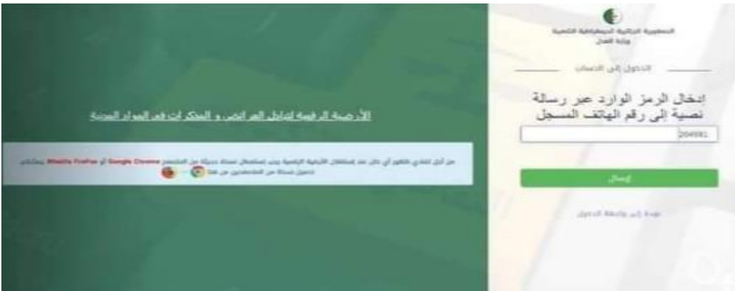
الشكل رقم 02 104

يقوم المحامي بإدراج اسم المستخدم وكلمة المرور ، والتي يتعين تغييرها عند الدخول الاولي للأرضية، بعد ذلك يتلقى المحامي رسالة نصية عبر هاتفه المحمول تتضمن رمز يتم ادراجه في الخانة المدرجة في الصورة التالية ومن ثما الضغط على زر " ارسال "