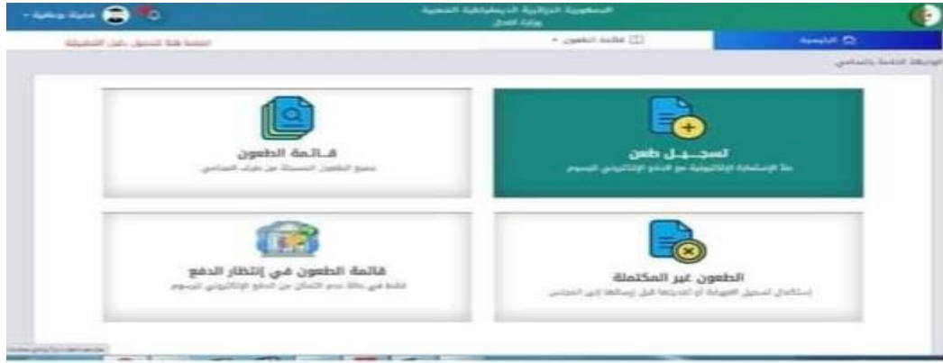
الشكل رقم 04.121

قائمة الطعون التي تظهر لمقدم الطعن المحامي الطاعن بعد ولوج محامي الطاعن (مستأنف، معارض، مقدم التماس اعادة النظر، مقدم اعتراض الغير خارج عن الخصومة، مرجع بعد الخبرة، ...) الى حسابه الالكتروني، تظهر له الواجهة الرئيسية التي تحتوي على: