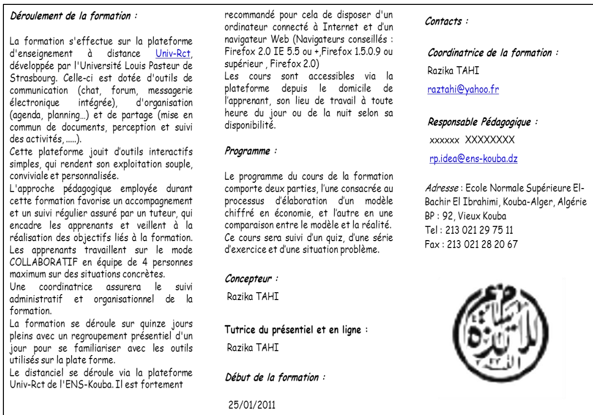
Figure 2 : Plaquette de présentation de la formation (verso)

Aux objectifs cités dans la plaquette, s'ajoute un autre objectif secondaire, mais dont l'importance n'est pas négligeable, et qui consiste à apprendre à utiliser une plateforme d'apprentissage en maîtrisant ses principales fonctions et outils de communication.